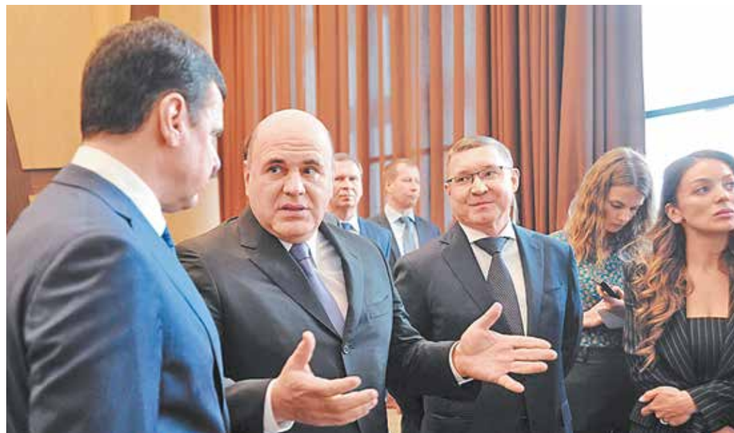
Председатель правительства РФ Михаил Мишустин и глава Минстроя России Владимир Якушев в кулуарах совещания о развитии малых городов

Модернизация коммунальной инфраструктуры станет основой развития небольших городов