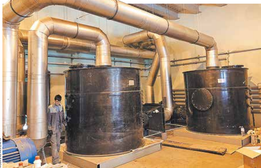
Адсорбционные фильтры в системе вентиляции Василеостровской канализационной насосной станции