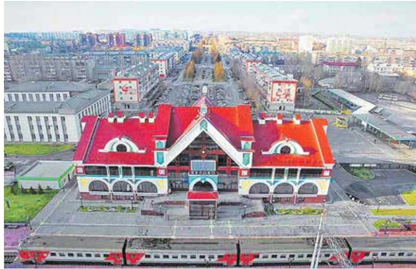
В рамках пилотных проектов расходы на модернизацию коммунальной инфраструктуры в Белове (Кемеровская область) составят 900 млн рублей

с.1 > «Повседневная жизнь людей требует самого насущного, без чего комфорт невозможен — это и новые трубы, и канализация, электросети», — отметил Мишустин, подчеркнув, что благополучие каждого муниципалитета напрямую зависит от того, насколько надежна будет инфраструктура ЖКХ.