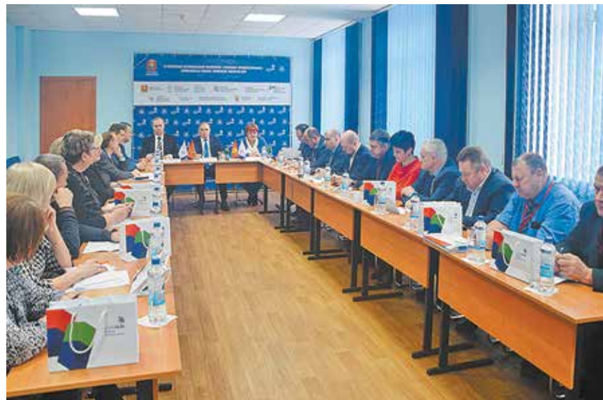
На конференции «Национальная система квалификаций: региональная модель развития в Липецкой области» (январь 2020 года)

В ближайшей перспективе ассоциация планирует внедрить риск-ориентированный подход при осуществлении контроля за деятельностью членов ОСМО, оптимизировать требования к специалистам по организации