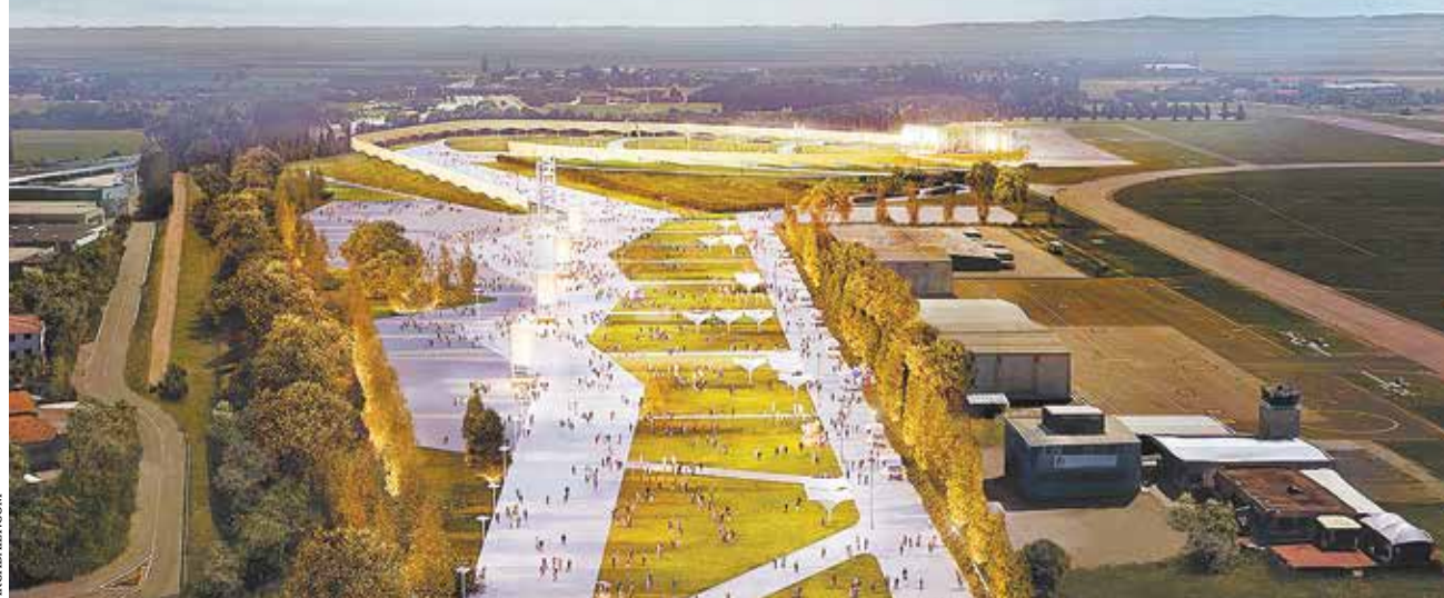
Проект новой концертной площадки RCF Arena

Кроме того, проектом строительства площадки предполагается создание по соседству большого парка, где будут проложены велосипедные и пешеходные дорожки, доступные для всех желающих во «внеконцертное время». Стоит отметить, что у RCF Arena хорошая транспортная доступность — рядом расположена железнодорожная станция, куда приходят как пригородные, так и высокоскоростные поезда.