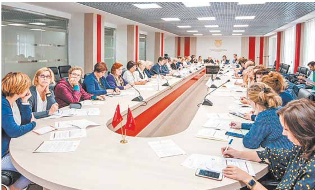
Ежегодно Главгосэкспертиза проводит около 100 обучающих семинаров, а также курсы повышения квалификации