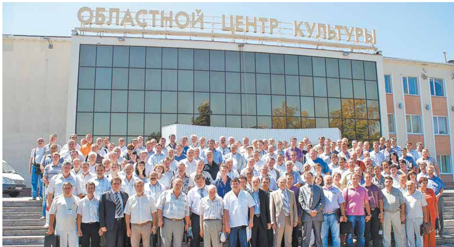
Участники общего собрания членов Ассоциации «Объединение строительно-монтажных организаций»

Акцент в системе саморегулирования должен быть сделан на качестве и безопасности строительства