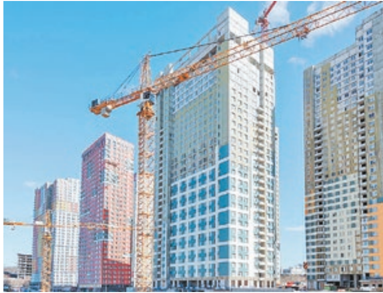
ЖК «Спутник» в Раздорах

такова средневзвешенная цена текущего предложения на рынке строящегося в Подмоскowie жилья