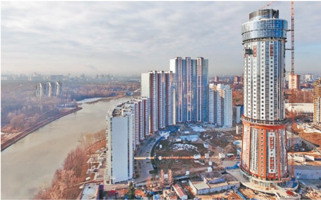
ЖК «Маяк» в Химках — самый высокий из строящихся в Подмоскovie домов, в нем 41 этаж

Московская область — в лидерах среди субъектов РФ по объемам жилищного строительства