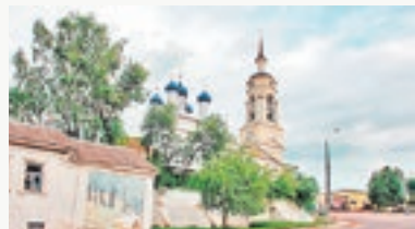
Один из участников конкурса — город Боровск