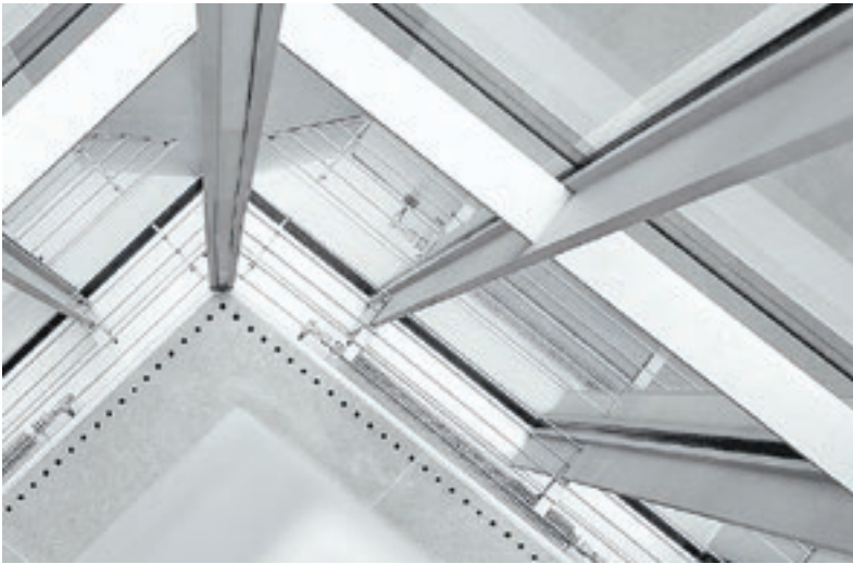
Алюминий широко используется для изготовления оконных конструкций