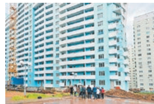
ЖК «Форт Карасун» — один из проблемных объектов Краснодара

В Краснодаре достроят три проблемных дома