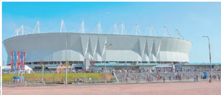
Стадион «Ростов-Арена» был построен к чемпионату мира по футболу 2018 года