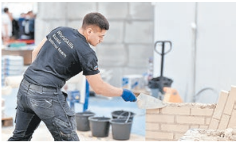
Тренировка национальной сборной WorldSkills Russia на выставке Batimat Russia-2019 (март 2019 года). Состязания проходили по четырем компетенциям строительного блока: «Сантехника и отопление», «Кирпичная кладка», «Малярные и декоративные работы», «Облицовка плиткой»