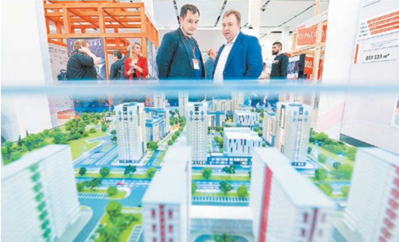
РААСН является стратегическим партнером международного архитектурного фестиваля «Зодчество» (на фото — один из проектов, представленных на «Зодчестве 2018»)

с.1 Мы каждый год готовим предложения о приоритетных направлениях развития исследований в сфере архитектуры, градостроительства и строительных наук, рассматриваем заявки на разработку СП и норм, разрабатываем методические материалы, мониторим исполнение исследований, их качество и так далее. Итогом этой большой работы становятся конкретные документы. Во многом благодаря активной позиции РААСН и поддержке Минобрнауки удалось воссоздать секцию «Строительные технологии и архитектура» в составе Межведомственного совета по присуждению премий правительства Российской Федерации в области науки и техники. В этом году вручены две премии по строительству и архитектуре: команде Национального исследовательского Мордовского государственного университета им. Н. П. Огарева — за разработку и внедрение биоцидных минеральных вяжущих и сухих строительных смесей; и команде Научно-исследовательского центра (НИЦ) «Строительство» — за разработку, производство и внедрение отечественных огнезащитных материалов. Новая команда ведомства во главе с министром Владимиром Якушевым поддержала основные направления развития РААСН, ее участие в разработке новой программы фундаментальных научных исследований в России на долгосрочный период (2021-2035 годы).