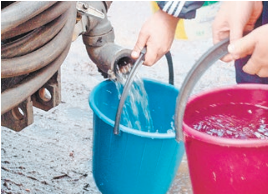
В некоторые районы Калмыкии питьевую воду приходится доставлять спецтранспортом