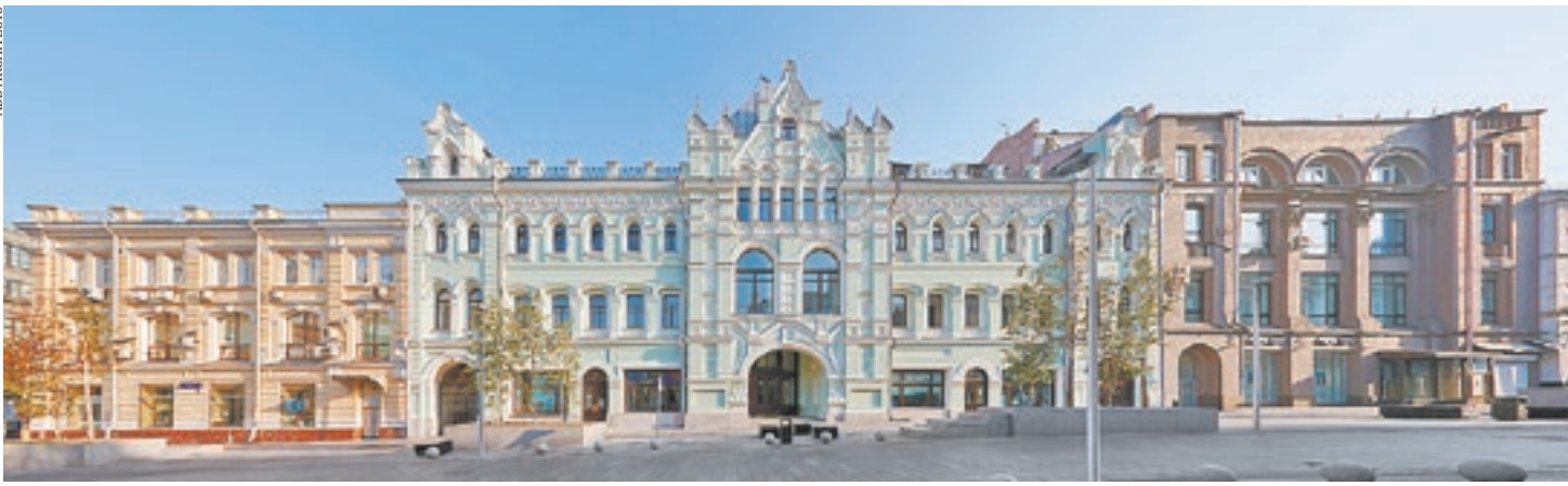
Фасад пассажа, выходящий на Пушкинскую улицу