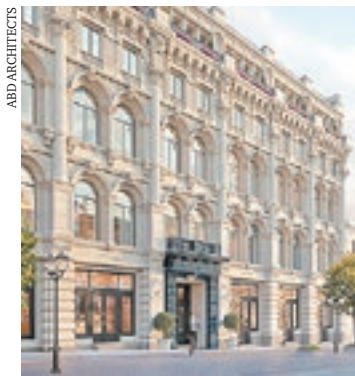
Так будет выглядеть здание со стороны Кузнецкого Моста после реставрации

Основной задачей проекта стало переосмысление и возврат зда-