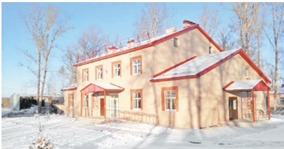
Фельдшерско-акушерский пункт в поселке Волошово, построенный по программе «Устойчивое развитие сельских территорий Ленинградской области»