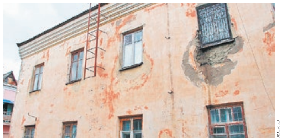
Дом №3 по улице Перегонной в Орске (Оренбургская область) является аварийным

Оренбургская область первой получила средства на расселение аварийного жилья в 2019-2020 годах