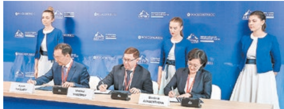
Соглашения о реализации проекта «Умный город» подписали глава Республики Саха (Якутия) Айсен Николаев, министр строительства и ЖКХ России Владимир Якушев и глава Якутска Сардана Авксентьева (слева направо)