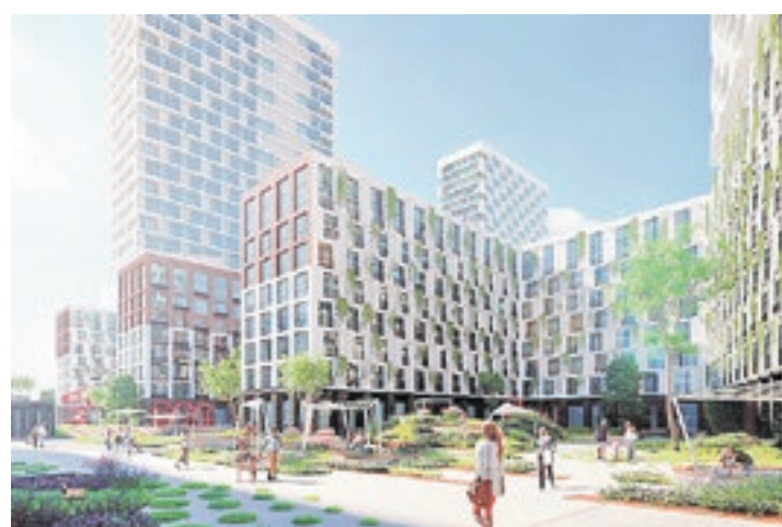
Проект ЖК «Событие» в Раменках

бульваров, скверов, пешеходных пространств. Свообразным каркасом всей «конструкции» станут два больших зеленых бульвара, которые свяжут жилые кварталы со станциями метро, объектами инфраструктуры и долиной реки Раменки. Архитекторы предложили также повторить в застройке естественный рельеф ландшафта: от более высоких кварталов комфорт- и бизнес-классов — к малоэтажным домам премиум-класса, расположенным непосредственно на границе природного заказника.