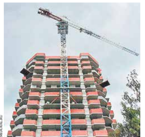
ЖК «Новый Уктус»

Недавно заместитель министра строительства и развития инфраструктуры Максим Махнутин проинспектировал ход работ в жилищных комплексах «Новый Уктус» и «Кольцовский дворик», не завершённых прежними застройщиками. На земельном участке ЖК «Новый Уктус» возведение дома началось в 2012 году. Планировалось поставить «свечку» высотой в 25 этажей на 243 квартиры. Однако из-за нехватки средств и плохой организации производственных процессов стройка остановилась на уровне 12-го этажа. В результате 190 человек до сих пор не получили свои квартиры. При содействии региональных властей для завершения строительства дома был найден новый инвестор — группа компаний «ТЭН». Немало времени и усилий понадобилось на то, чтобы получить от прежнего застройщика, в отношении которого было заведено уголовное дело, необходимые документы и права на стройплощадку. Пришлось дорабатывать и проект, в итоге в целях безопасности число этажей сократили до шестнадцати.