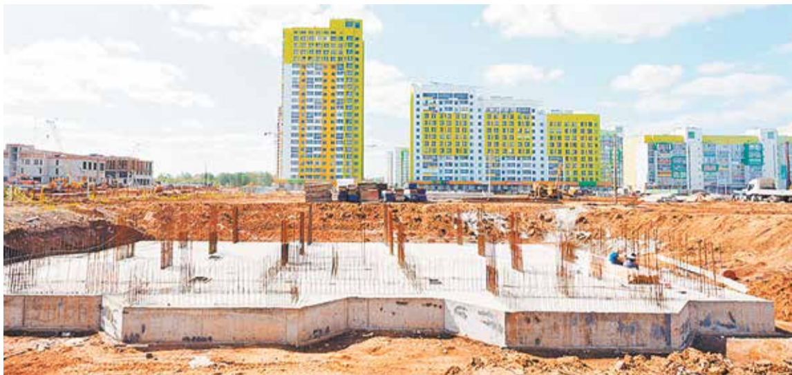
ЖК «Яркий» в поселке Ясино-1 Всеволожского района Ленобласти