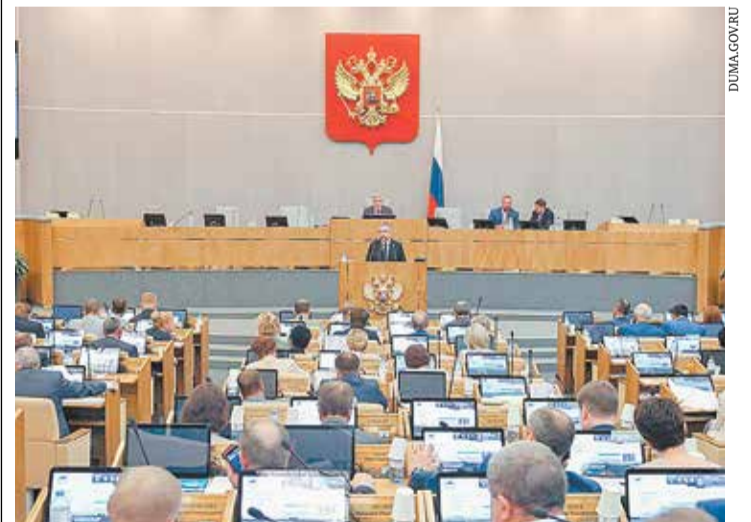
Пленарное заседание Государственной Думы, на котором были приняты законы, продолжающие реформу долевого строительства

Для удобства работы застройщиков планируется также перевести в электронный вид все административные процедуры, связанные с выдачей заключения о соответствии (ЗОС). При этом законопроектом предусмотрен полный отказ от ЗОС в отношении объектов, стро-