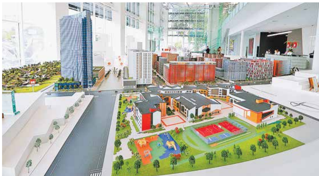
Проект комплексного развития территории промзоны «ЗИЛ» в Москве