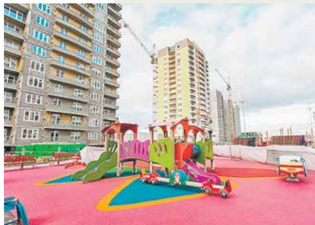
ЖК «Преображенский» в Тюмени

22 июня по завершении заседания Межправительственного совета стран СНГ по сотрудничеству в строительной деятельности члены делегаций осмотрели ряд жилых и социальных объектов в Тюмени. Сначала гостям показали новые школу и детский сад в районах Ямальский-2 и