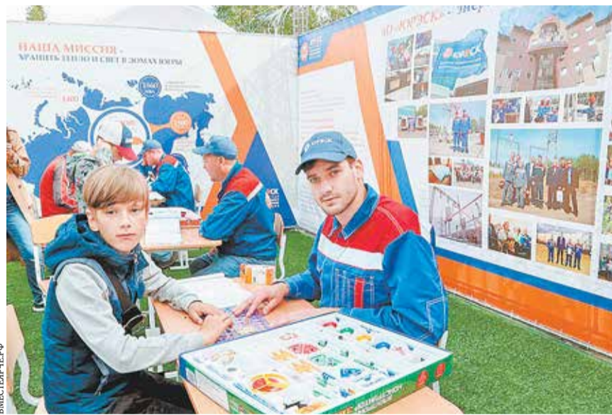
В День России, 12 июня, в Ханты-Мансийске прошли мероприятия фестиваля #ВместеЯрче

Найдется в программе время и для обсуждения вопросов работы с молодежью. В заключительный день работы