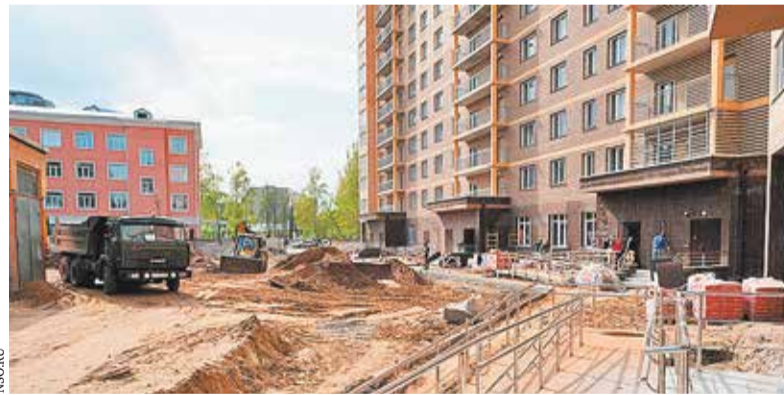
ЖСК «Залесский» в Новосибирске

Сейчас в регионе реализуется 11 соглашений о МИП. Одно из них предусматривает достройку 16-этажного дома на улице Залесского. Строительство дома началось в 2003 году, но после признания ООО «Гарантсервисстрой» в 2010 году банкротом пра-