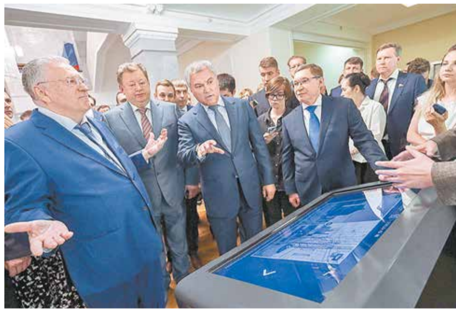
Глава Минстроя РФ Владимир Якушев, председатель ГД Вячеслав Володин, председатель Комитета по аграрным вопросам Владимир Кашин и руководитель фракции ЛДПР Владимир Жириновский (справа налево) осматривают выставку «Стандарт комплексного развития территорий: инструмент создания комфортного города»

В Госдуме обсудили правила комплексного развития территорий