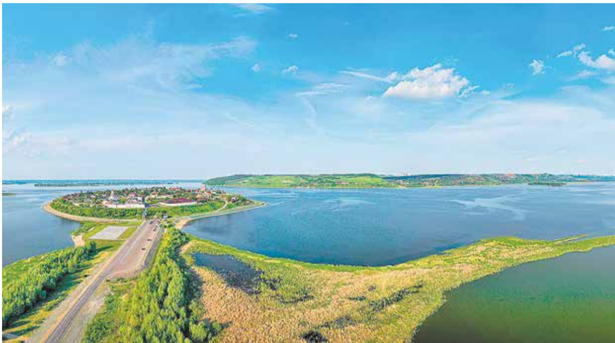
Волга в районе слияния со Свягой