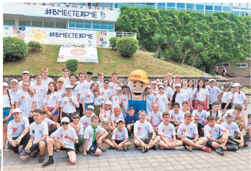
Участники смены Всероссийского фестиваля энергосбережения и экологии #ВместеЯрче в центре «Орленок»