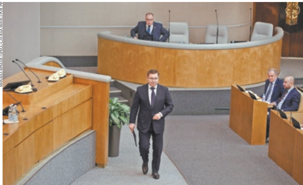
Глава Минстроя России Владимир Якушев на правительственном часе в Государственной Думе

Глава Минстроя рассказал парламентариям о перспективах развития жилищного строительства