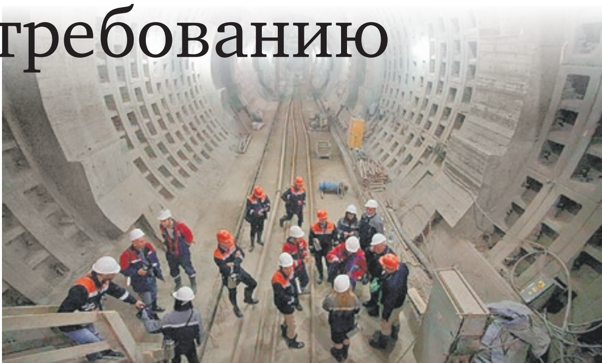
В марте 2018 года рабочие «СМУ-11 Метрострой» объявили забастовку из-за многомесячной задержки зарплаты