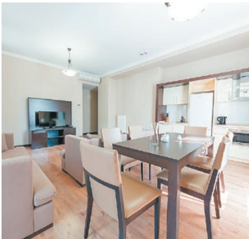
Апарт-отели, в которых более 10% номеров будет иметь кухни, признают жильем, а девелоперы обяжут строить социнфраструктуру