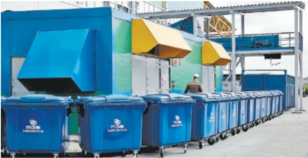
Один из крупнейших в России мусоросортировочных заводов был открыт в прошлом году в Тюмени

Эксперты считают, что создание госкомпании в сфере обращения с ТКО активизирует «мусорную» реформу