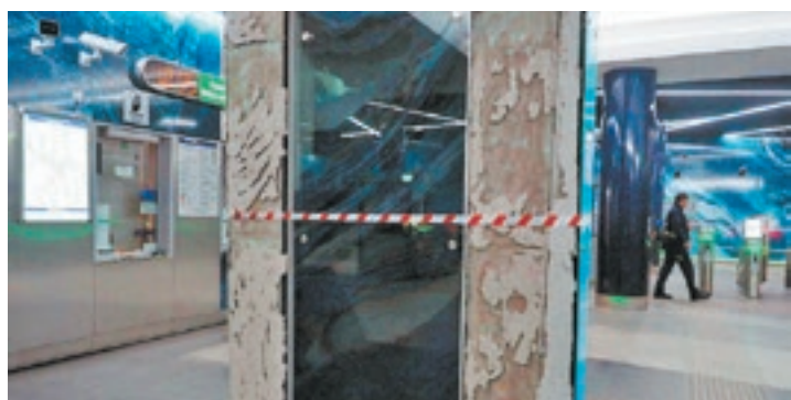
В конце января нынешнего года на станции «Новокрестовская» сразу в нескольких местах отвалилась облицовочная плитка