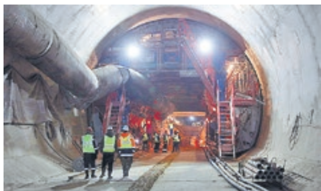
Торжественная сбойка железнодорожного тоннеля

Строители готовятся к началу железнодорожного сообщения через Крымский мост