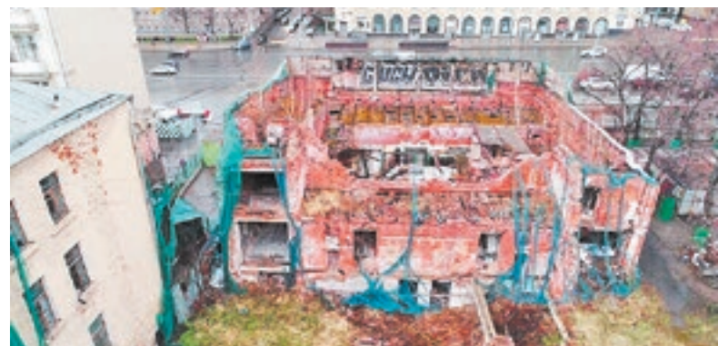
«Форум» — один из старейших кинотеатров Москвы. В 2002 году пожар практически полностью уничтожил здание