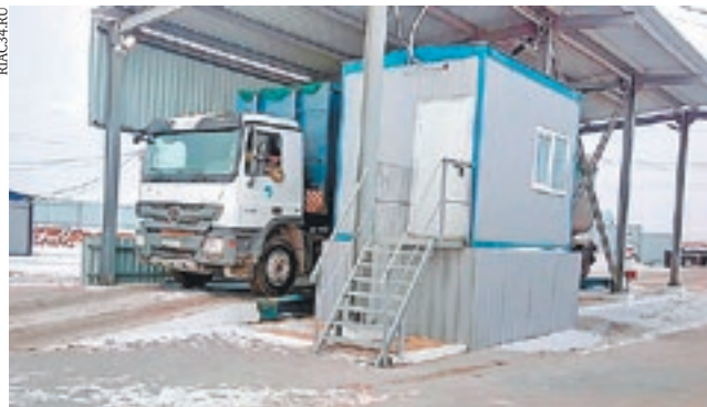
Светлоярский полигон ТКО

В Волгоградской области заработал крупный полигон ТКО