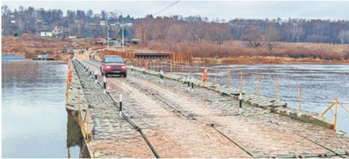
Наплавной мост, по которому сегодня осуществляется автомобильное сообщение через реку Пур

1. Решение об использовании автомобильной дороги или участка автомобильной дороги на платной основе может быть принято при условии обеспечения возможности альтернативного бесплатного проезда транспортных средств по автомобильной дороге общего пользования либо при условии обеспечения возможности альтернативного бесплатного проезда до ввода в эксплуатацию строящейся или реконструируемой платной автомобильной дороги или используемого на платной основе участка автомобильной дороги.