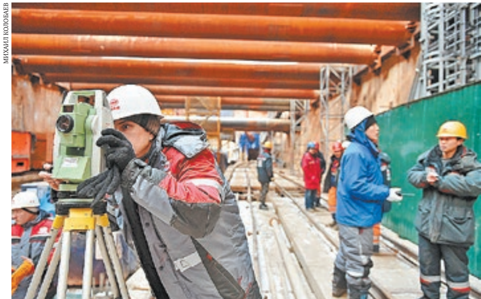
Строительство станции метро «Прспект Вернадского» на БКЛ