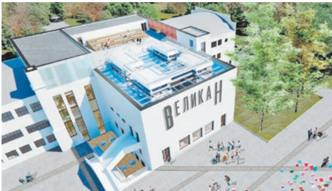
Проект реконструкции кинотеатра «Великан»