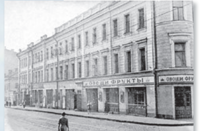
Обособняк купца Булошников на Большой Никитской улице вчера (справа), сегодня и завтра (внизу)