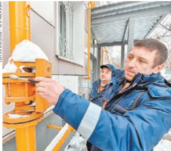
Внеплановая проверка газового оборудования в Москве (январь 2019 года)