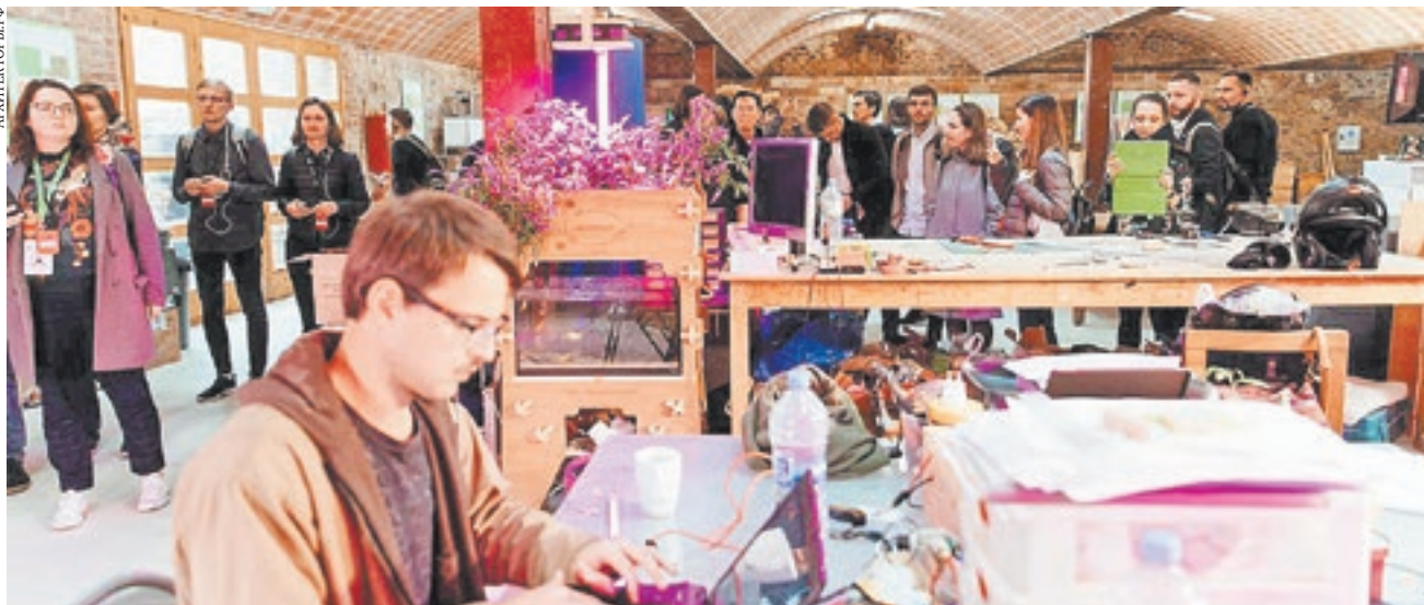
В Барселоне участники программы АРХИТЕКТОРЫ.РФ посетили архитектурную мастерскую Ricardo Bofill Taller de Arquitectura — ведущую мировую компанию в области архитектуры, планировки и дизайна

Молодые профессионалы рассказали, что им дало участие в программе АРХИТЕКТОРЫ.РФ