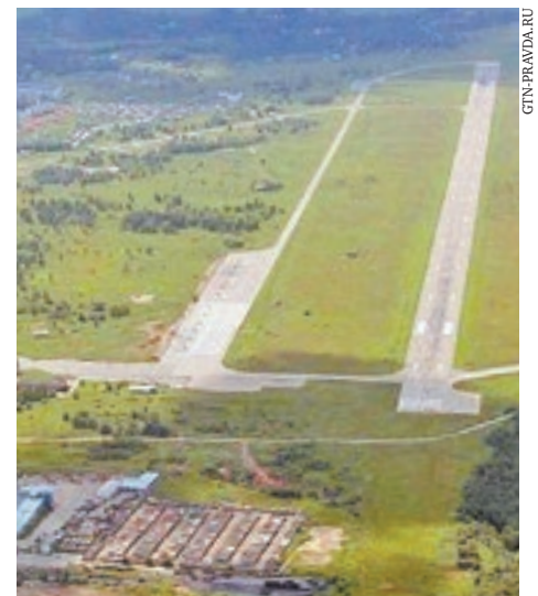
Новый аэропорт будет построен на месте военного аэродрома «Сиверский»

В соответствии с «дорожной картой» строительство аэропорта «Сиверский» начнется осенью 2019 года. На первом этапе это будет