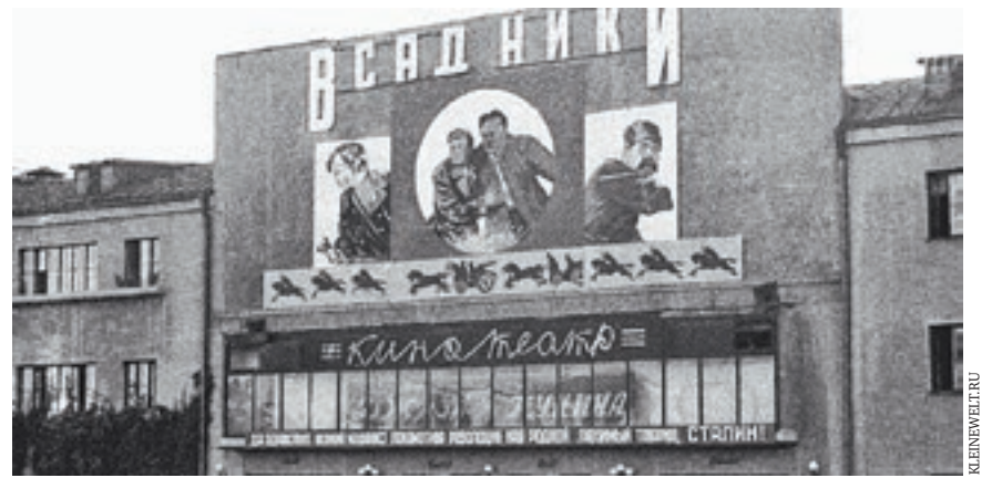
Так кинотеатр выглядел в 30-е годы