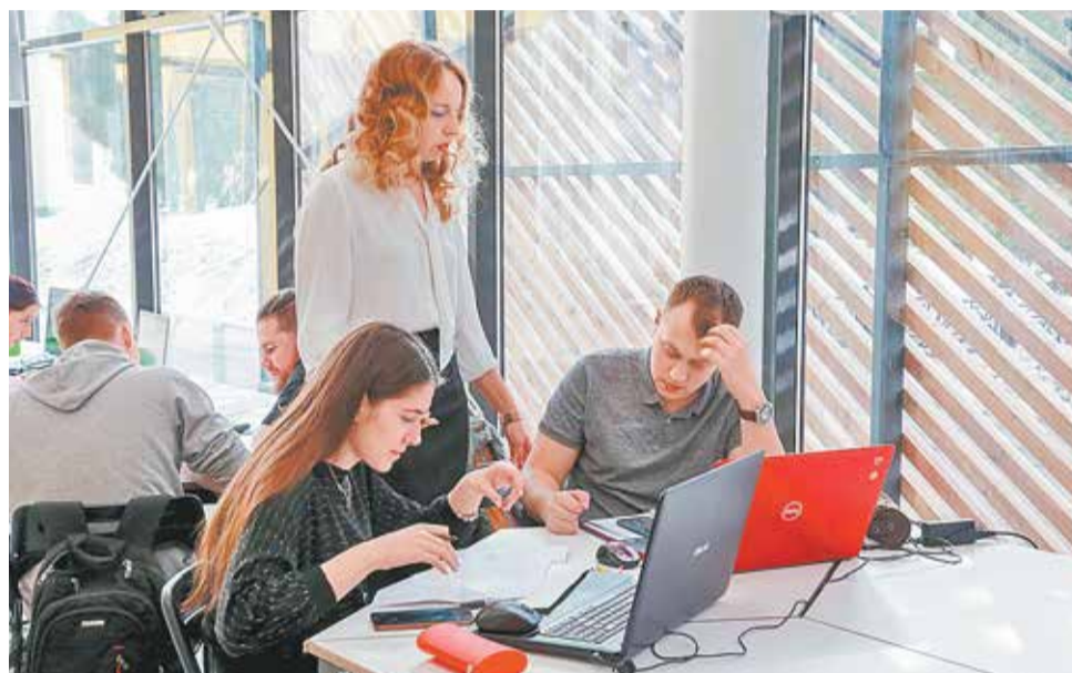
Студенты Казанского государственного архитектурно-строительного университета на занятиях в Центре инженерных систем в строительстве

Результатом этой учебно-практической деятельности со студентами стало расширение реестра образовательных экспертов по ЭКР, который формируется из числа пользователей площадки «Энергоэффективность», которые успешно подтвердили свои теоретические знания и практические навыки. Он включает 191 человека, из которых около пятидесяти — это студенты пяти вузов России (Тамбовского государственного университета им. Г.Р.