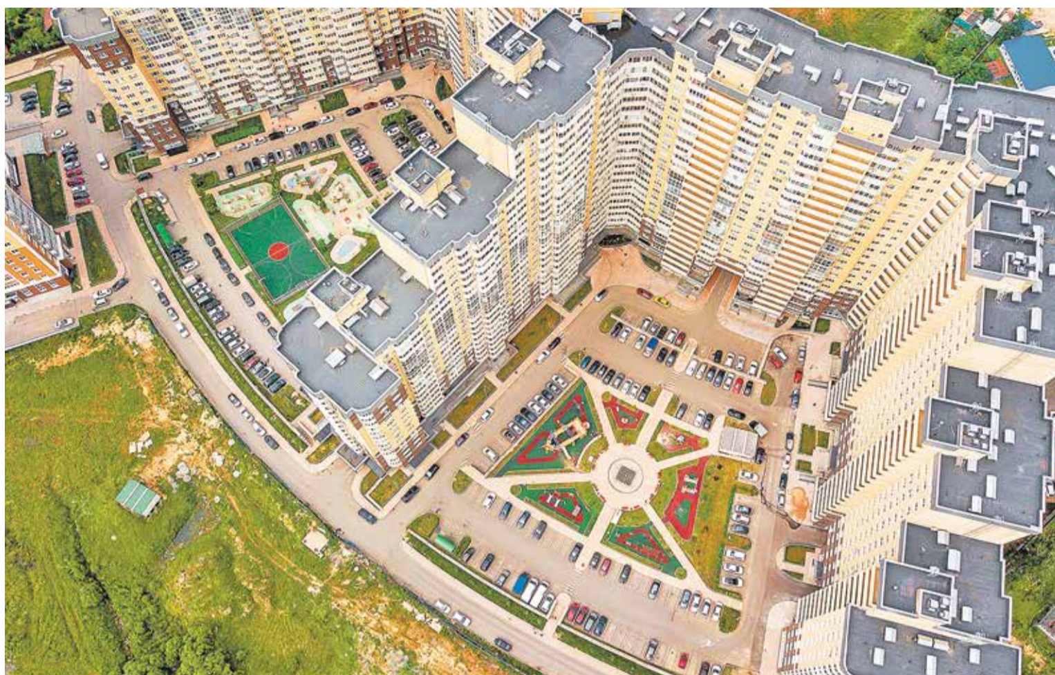
ЖК «Одинбург» в Одинцово

Наиболее востребованный формат недвижимости в «Одинбурге» — однокомнатные квартиры площадью до 42 кв. метров и двухкомнатные площадью до 70 кв. метров. Растет также интерес семейных покупателей к трехкомнатным квартирам. Спросом пользуются жилые помещения как с предчистовой, так и с чистовой отделкой.