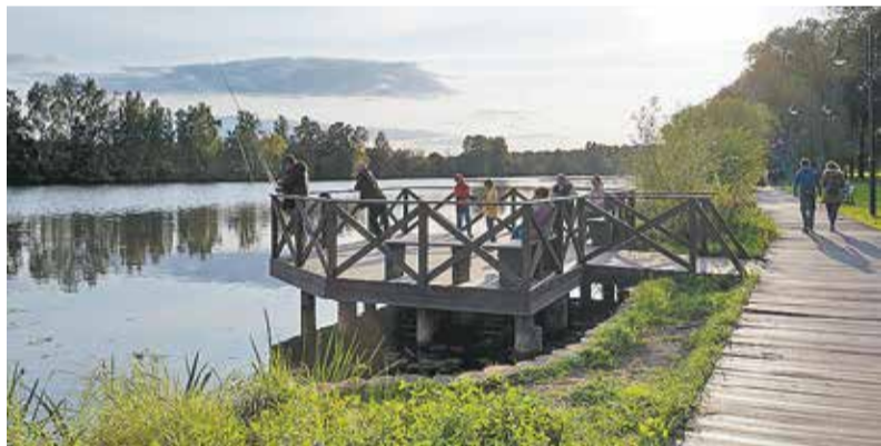
Набережная реки Москвы

Усадьба «Архангельское» — дворцово-парковый ансамбль конца XVIII — начала XIX века. Расположена на берегу старицы Москвы-реки, в двух километрах к юго-западу от города Красногорска (Московская область). Особо ценный объект культурного наследия.