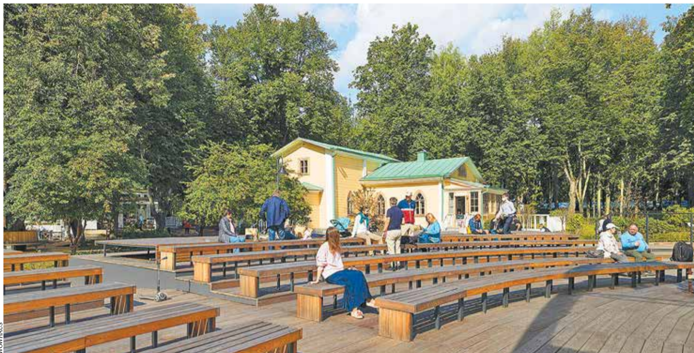
Амфитеатр у колоннады — площадка для проведения концертов и рекреационная площадка для посетителей