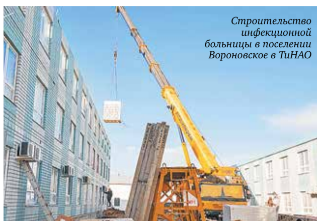
Строительство инфекционной больницы в поселении Вороновское в ТиНАО

Эти преимущества позволили продукту быстро стать востребованным. Modulbau открывает завод по производству сантехнических модулей в г. Домодедово (Московская область) пло-