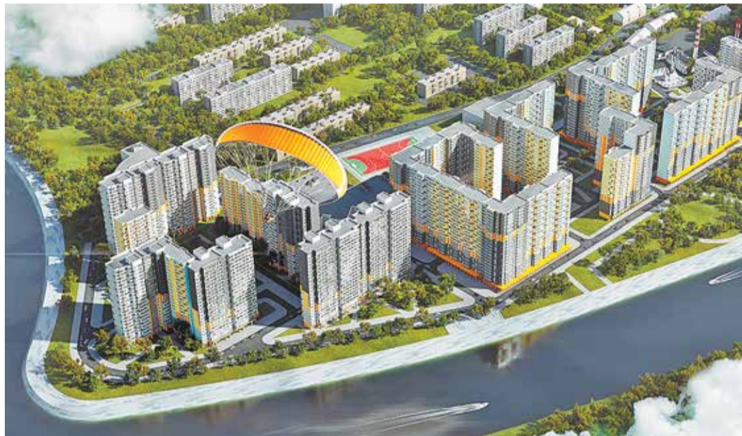
Проект ЖК «Бригантина» в городе Долгопрудном