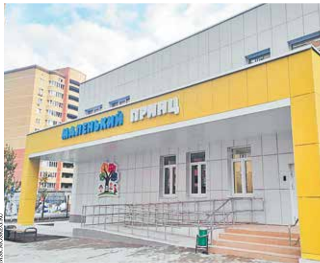
Новый детский сад в Химках

В будущем году в Подмоскovie планируется построить 45 социальных объектов