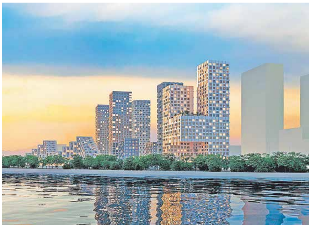
Первая очередь проекта застройки территории «ЗИЛ-Юг»

Сразу после снятия в Москве режима самоизоляции Группа «Эталон» возобновила передачу дольщикам объ-