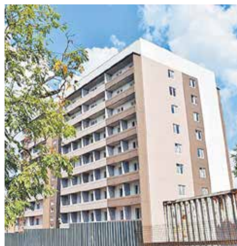
228-квартирный дом на улице Зеленина построен по программе переселения граждан из аварийного жилья

■ Возможности привлекать деньги дольщиков напрямую российские застройщики лишились с 1 июля 2019 года. С этой даты средства граждан, вложенные в приобретение нового жилья, хранятся на счетах эскроу в банках. Строители могут воспользоваться ими только после сдачи объекта в эксплуатацию, поэтому возведение домов в основном ведется на банковские кредиты, так называемое проектное финансирование.