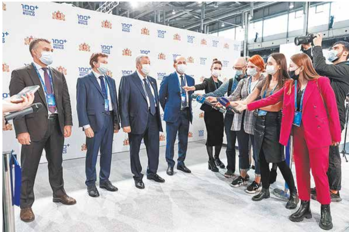
На церемонии открытия форума в Екатеринбурге