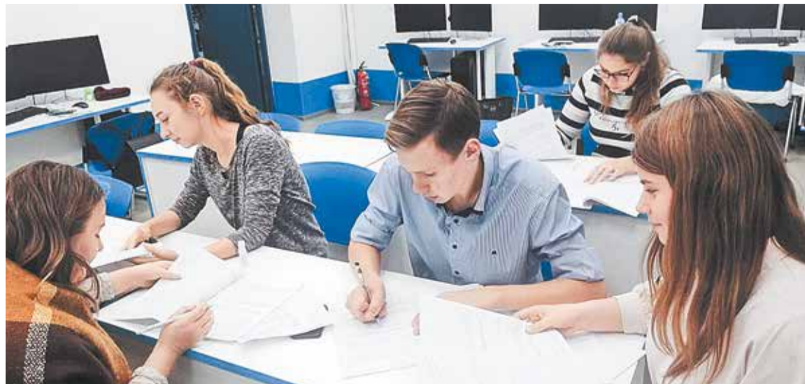
Студенты Миасского геологоразведочного колледжа, обучающиеся по специальности «Управление, эксплуатация и обслуживание МКД»