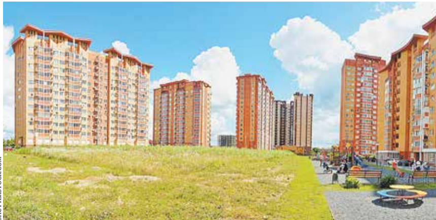
ЖК «Гусарская баллада» в городе Одинцово