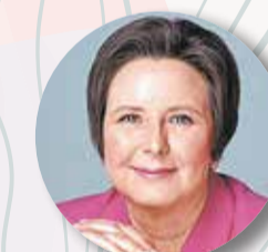
РАЗВОРТНЕВА Светлана , заместитель председателя Комитета Госдумы РФ по строительству и ЖКХ