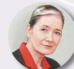
ХОВАНСКАЯ Галина , руководитель Комиссии Госдумы РФ по обеспечению жилищных прав граждан