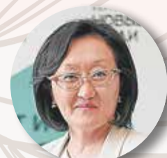
АВКСЕНТЬЕВА Сардана , заместитель председателя Комиссии Госдумы РФ по обеспечению жилищных прав граждан