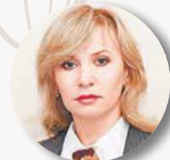
КОРНИЕНКО Ольга , директор Департамента жилищной политики Минстроя России