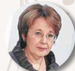
ДМИТРИЕВА Оксана , член Комиссии Госдумы РФ по обеспечению жилищных прав граждан