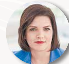
КОСТЕНКО Наталья , член Комиссии Госдумы РФ по обеспечению жилищных прав граждан