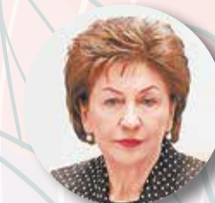
КАРЕЛОВА Галина , заместитель председателя Совета Федерации РФ