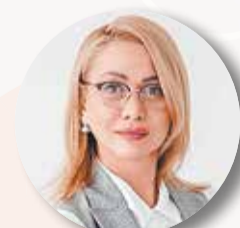
РОДИОНОВА Ольга , директор Департамента социально-экономического развития отдельных территорий Минстроя России