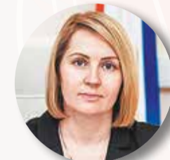
ИВАНОВА Светлана , статс-секретарь, заместитель министра строительства и ЖКХ РФ