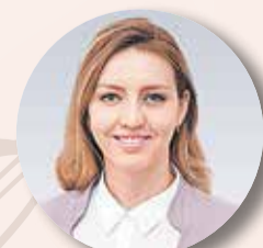
СИНИЧ Мария , директор Департамента комплексного развития территорий Минстроя России