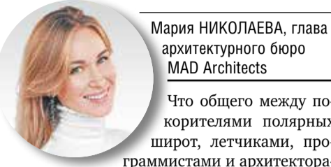
Мария НИКОЛАЕВА, глава архитектурного бюро MAD Architects

Что общего между покорителями полярных широт, летчиками, программистами и архитекторами? Долгие годы эти профессии считались почти исключительно мужскими. Последний пункт в этом списке может вызвать у современного человека некоторое удивление, но углубившись в прошлое, можно узнать, насколько тернист был путь женщин в мире большой архитектуры.