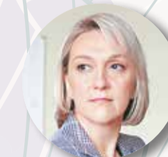
КНЯЖЕВСКАЯ Юлия , председатель Комитета по архитектуре и градостроительству Москвы