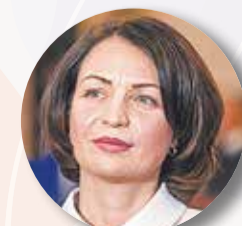
ФАДИНА Оксана , член Комиссии Госдумы РФ по обеспечению жилищных прав граждан