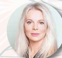
КУЗЬМИНА Александра , заместитель председателя Комитета по архитектуре и градостроительству Московской области, главный архитектор региона