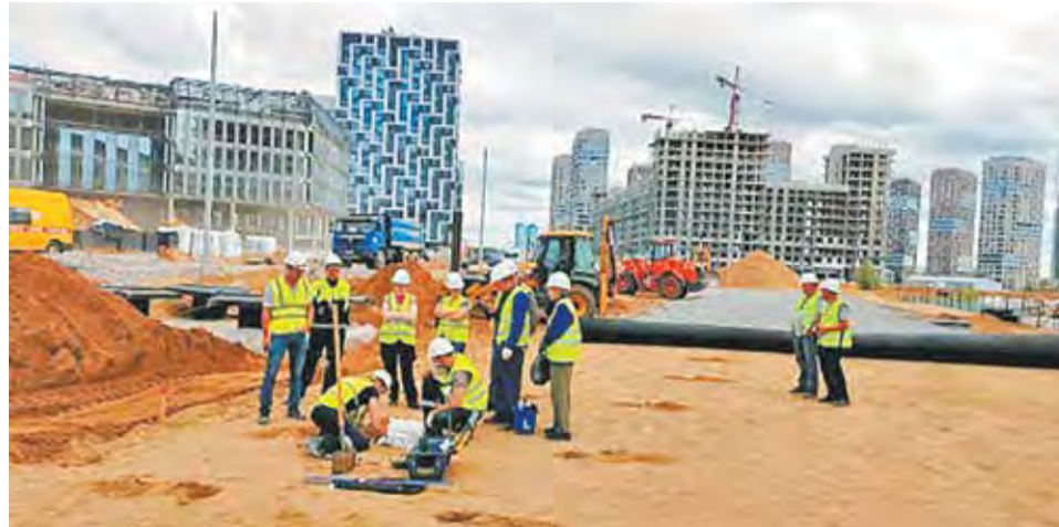
На территории строящегося многофункционального спортивного комплекса сотрудники Центра экспертиз произвели отбор проб материалов дорожного полотна

Московские эксперты фиксируют малейшие нарушения в работах по программе реновации