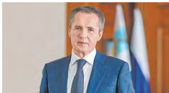
Вячеслав ГЛАДКОВ, губернатор Белгородской области

Белгородчина демонстрирует высокие темпы роста жилищного и дорожного строительства