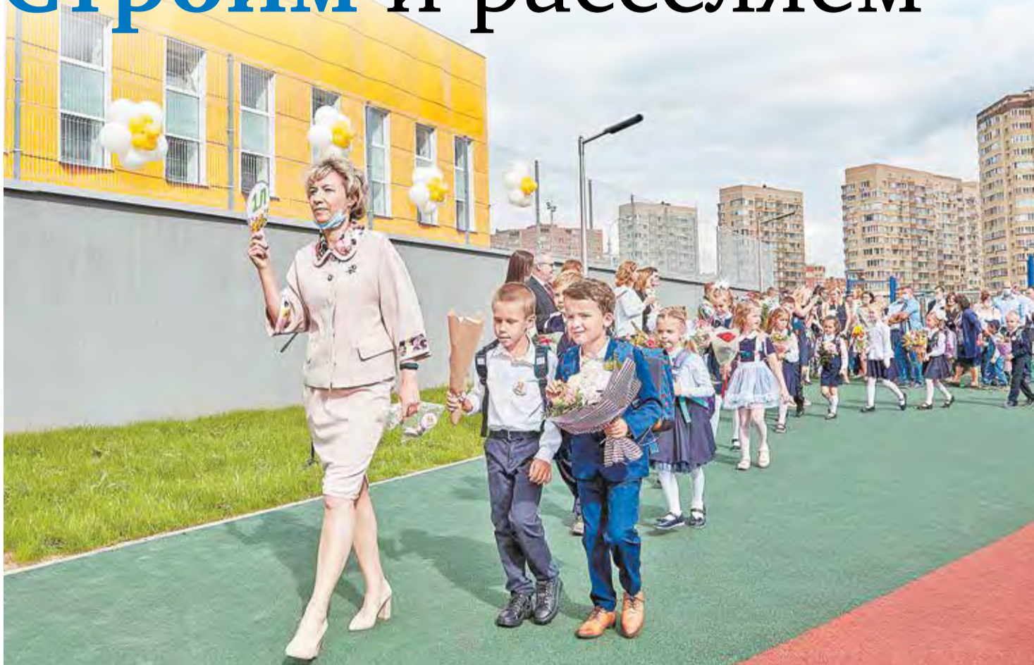
Открытие новой школы на 1100 мест в Мытищах