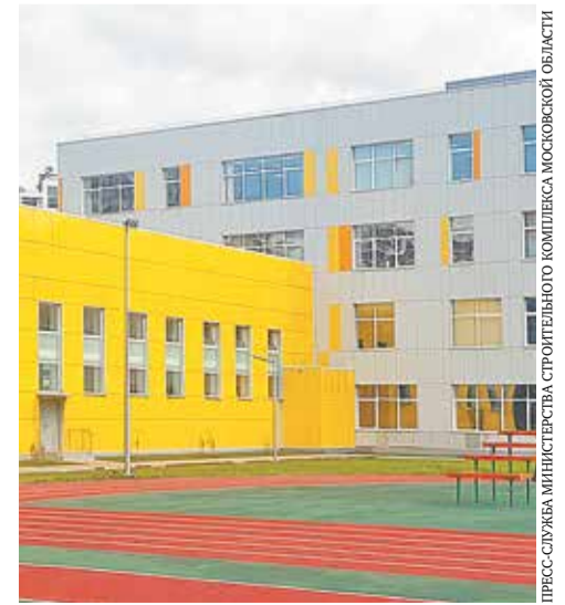
ПРЕСС-СЛУЖБА МИНИСТЕРСТВА СТРОИТЕЛЬНОГО КОМПЛЕКСА МОСКОВСКОЙ ОБЛАСТИ

В.Л.: В преддверии праздника хочу сказать слова особой благодарности всем работникам и ветеранам стройотрасли, архитекторам, проектировщикам, всем тем, кто выбрал своей профессией созидательный труд на благо развития Подмосковья, пожелать здоровья и счастья их семьям.