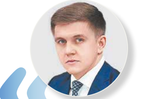
Вячеслав ШАПОШНИК , врио министра ТЭК и ЖКХ Краснодарского края

Стоит отметить, что муниципалитеты Кубани ежегодно меняют по 5% изношенных сетей, но этого, конечно же, недостаточно. Поэтому в ходе реализации программы «Модернизация коммунальной инфраструктуры» запустим масштабный процесс обновления.