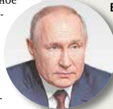
Владимир ПУТИН, президент РФ: