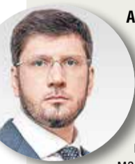
Александр ЛОМАКИН, первый заместитель министра строительства и ЖКХ РФ:

Между тем, с начала текущего года аукционы по замене лифтов в МКД состоялись только в 31 регионе. Заключены контракты всего на 4 836 лифтов, причем 2 400 из них — это один контракт Щербинского лифтостроительного завода (ЩЛЗ) с Нижегородской областью. Но лифты, напомнил Олег Никандров, нужны и для новых домов, так как около 80% из 9 500 строящихся МКД имеют высотность в шесть и более этажей.