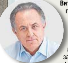
Виталий МУТКО, генеральный директор «ДОМ.РФ»: