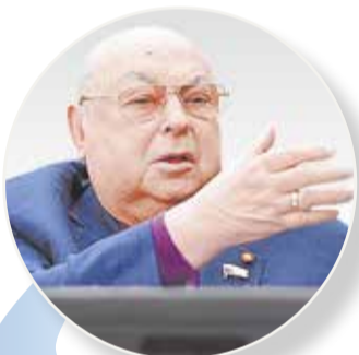
Владимир РЕСИН, депутат Госдумы РФ, заслуженный строитель РСФСР