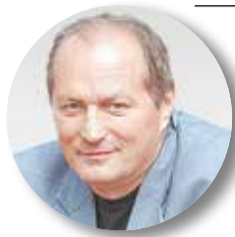
Борис СОШЕНКО, председатель Профсоюза строителей России