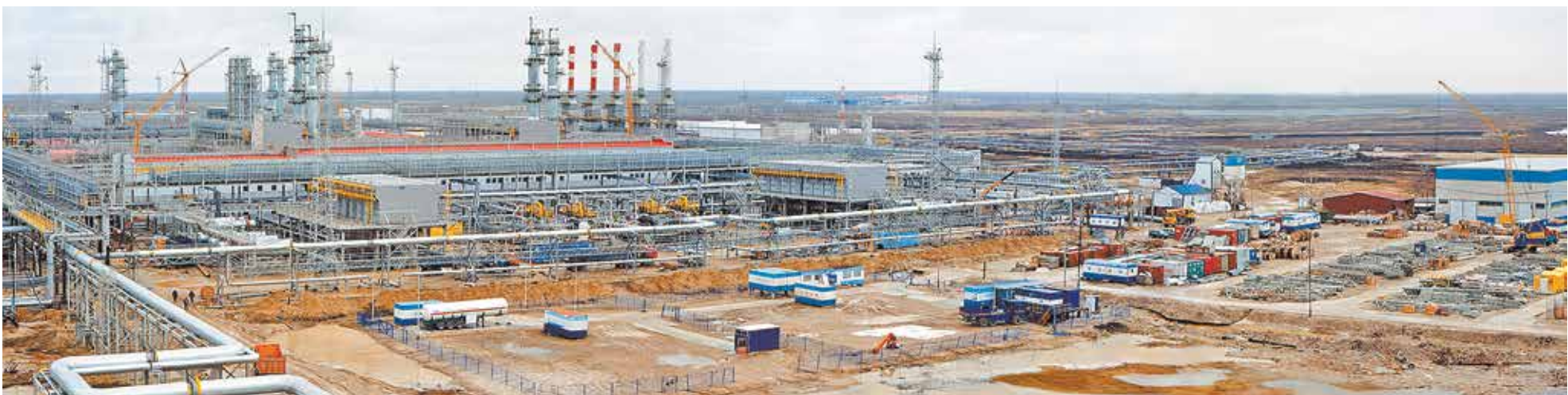
Размер установки УКПГик, которую ВНЗМ построил за 4,5 года, — 56 гектаров