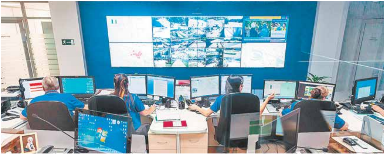
Единый центр оперативного реагирования города Тюмени