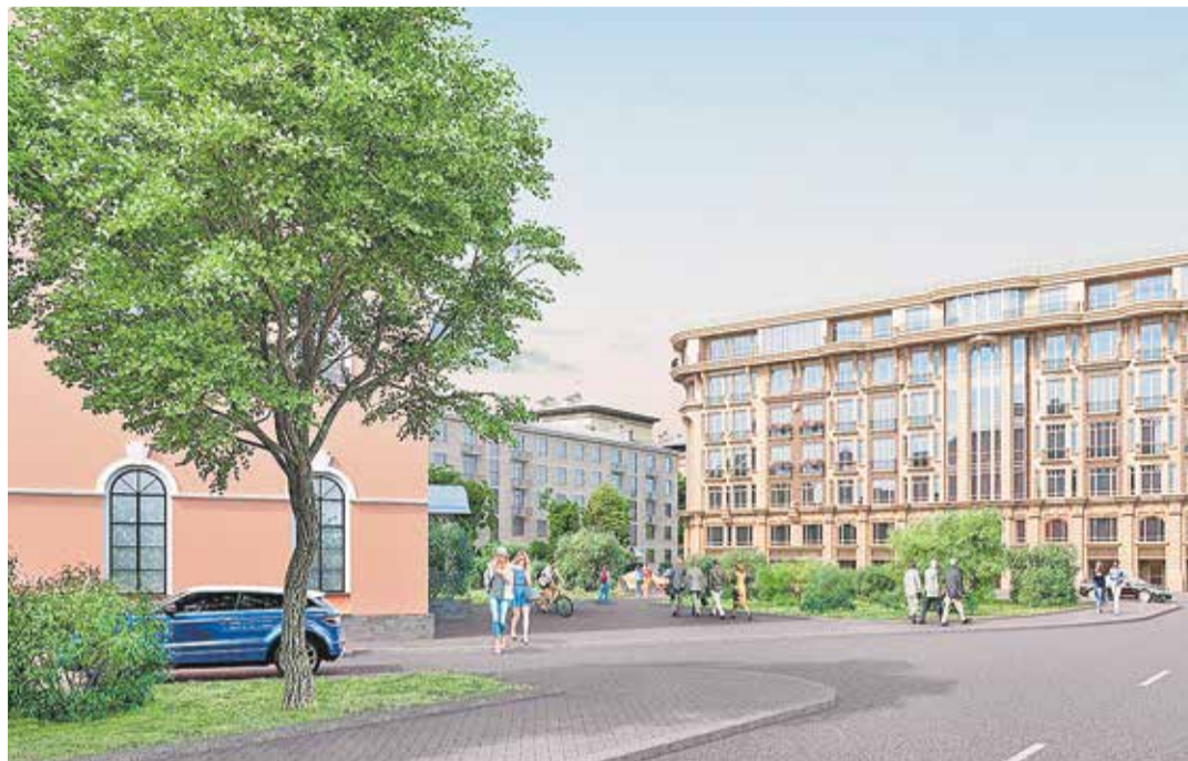
Проект жилого комплекса на ул. Гастелло (слева — здание Чесменского дворца)

Дома на улице Лени Голикова и на проспекте Стачек, где работает компания «Воин-В», уже почти достроены. По соседству с ними находится ан-