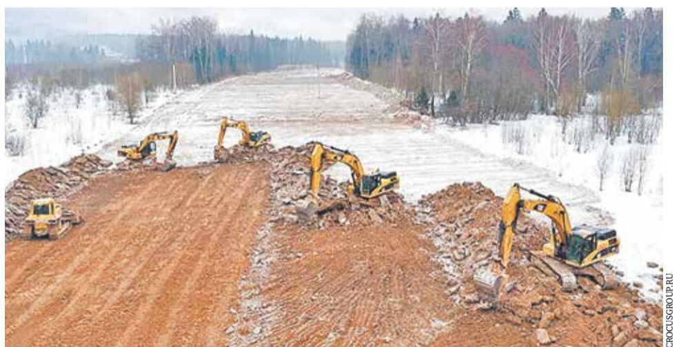
На строительстве Центральной кольцевой автодороги

Новый глава «Автодора» рассказал, почему «буксует» ЦКАД