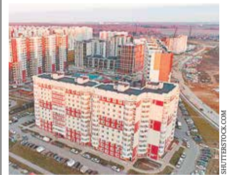
ЖК «Новые Ватутинки» в Новой Москве

Все это позволит постепенно преобразовать столицу, превратить ее из моноцентричного города, в котором большая часть рабочих мест сосредоточена в центре, в полицентричный. В городе с множеством точек притяжения удастся избежать центростремительных транспортных потоков, как сейчас, когда ежедневно 40% населения едет на работу в центр, а вечером — обратно. «В нашей стране, по сути, появится еще один город-миллионник, — отметил заместитель мэра Москвы по вопросам градостроительной политики и строительства Марат Хуснуллин. — В России не реализовывали таких масштабных проектов последние 20-30 лет. Мы открываем огромную площадку для развития столицы и в результате хотим получить полноценный и взаимосвязанный город с транспортной и социальной инфраструктурой».