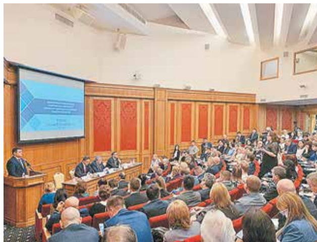
На Всероссийском обучающем семинаре по вопросам расселения аварийного жилья

В пресс-службе Минстроя России отметили, что, хотя термин «ветхое жилье» постоянно используется, точного его определения в законодательстве не было. По сути, ветхое жилье — это жилье сильно изношенное, но еще не ставшее аварийным. Границу между аварийным и ветхим жильем предполагается провести таким образом: аварийное жилье создает угрозу жизни и здоровью граждан и требует обязательного расселения, ветхое жилье таких угроз не создает и при условии проведения мониторинга технического состояния и поддерживающего ремонта может эксплуатироваться еще некоторое время. «Чтобы не возникало смешения этих понятий и разницы в оценках состояния дома, Минстроем России подготовлены изменения в постановление правительства РФ №47, которое устанавливает порядок обследования домов», — пояснили в ведомстве. — Изменения конкретизируют критерии отнесения домов к категориям аварийных и ветхих. Для принятия решения о состоянии до-