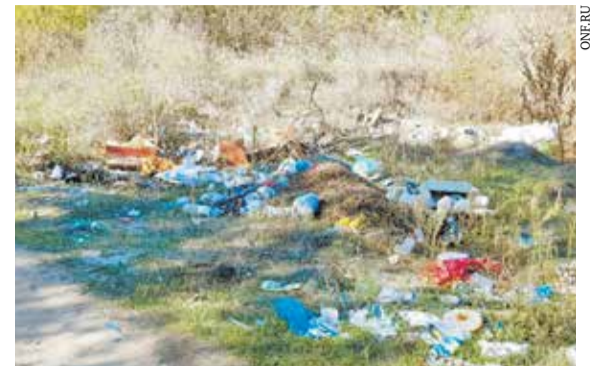
Свалка в городе Семикаракорске, которая была «убрана» с помощью фоторедактора

Поэтому, как пояснили в министерстве ТЭК и ЖКХ Краснодарского края, власти Кубани приняли решение о целесообразности сохранения прежней системы сбора и транспортировки ТКО действующими мусоровывозящими предприятиями. С регоператорами заключены допсоглашения по изменению сроков начала их работы, департаменту цен и тарифов Краснодарского края предложено пересмотреть тарифы. В течение 2019 года планируется отработать новую схему, навести порядок на территориях муниципальных образований с тем, чтобы регоператоры начинали работать с «чистого контейнера», а не с уборки мусорных завалов.