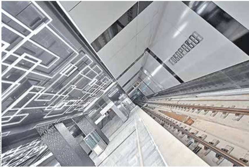
Станция метро «Говорово»

Строительство жилья в Новой Москве временно приостанавливается