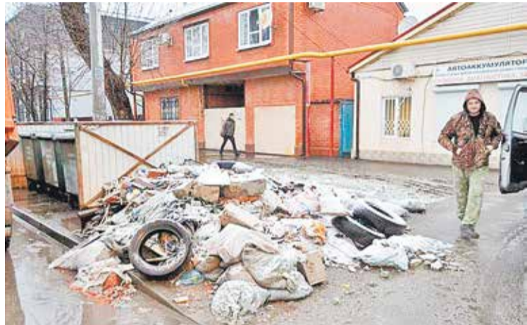
В начале года контейнерные площадки в Краснодаре оказались завалены мусором

Власти Краснодарского края вынуждены отложить «мусорную» реформу до 2020 года