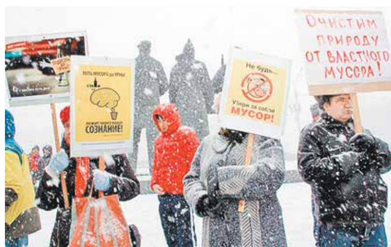
Митинг против строительства в Новосибирской области мусоросортировочных заводов

А в 2017 году в Санкт-Петербурге администрация Приморского района «подкорректировала» на фотографии дорогу, чтобы отчитаться о проделанной работе. Там дело тоже закончилось увольнением «сообразительного» чиновника.