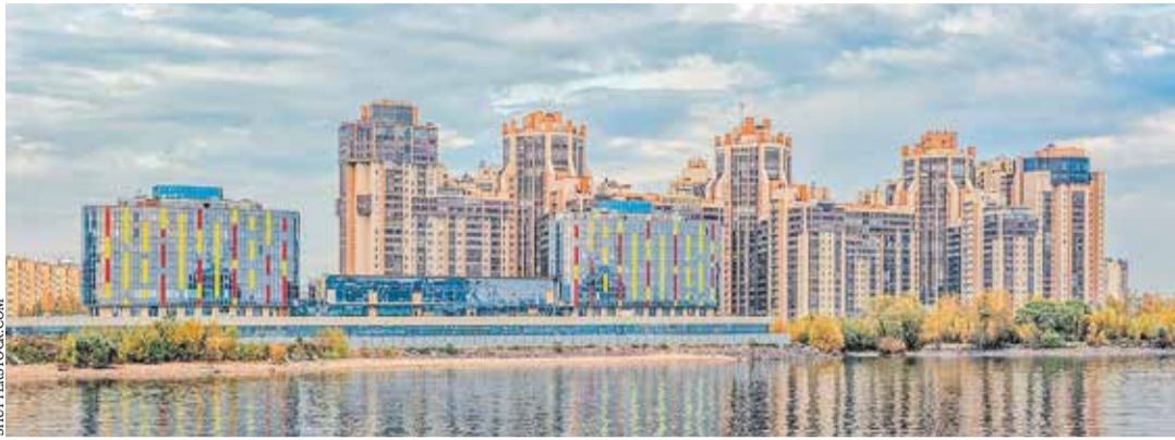
ЖК «Золотая гавань» в Приморском районе Санкт-Петербурга