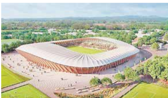
Проект первого в мире полностью деревянного стадиона футбольного клуба Forest Green Rovers в Глостершире (Англия)