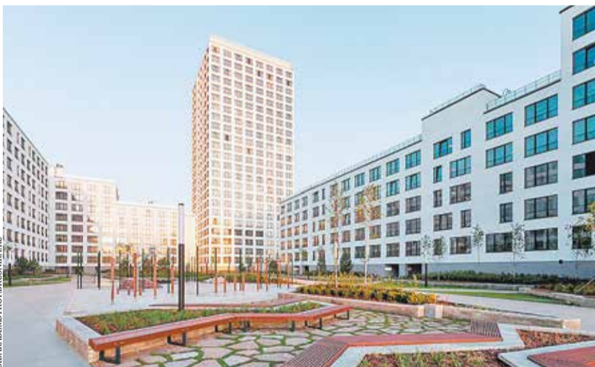
При проектировании микрорайона «Европейский берег» в Новосибирске использовались BIM-технологии

Архитекторы — за, застройщики сомневаются