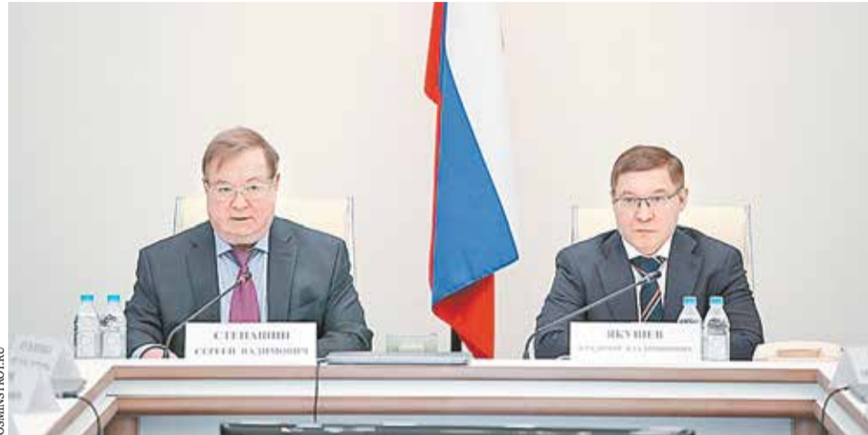
Председатель Общественного совета при Минстрое РФ Сергей Степашин (слева) и министр строительства и ЖКХ РФ Владимир Якушев