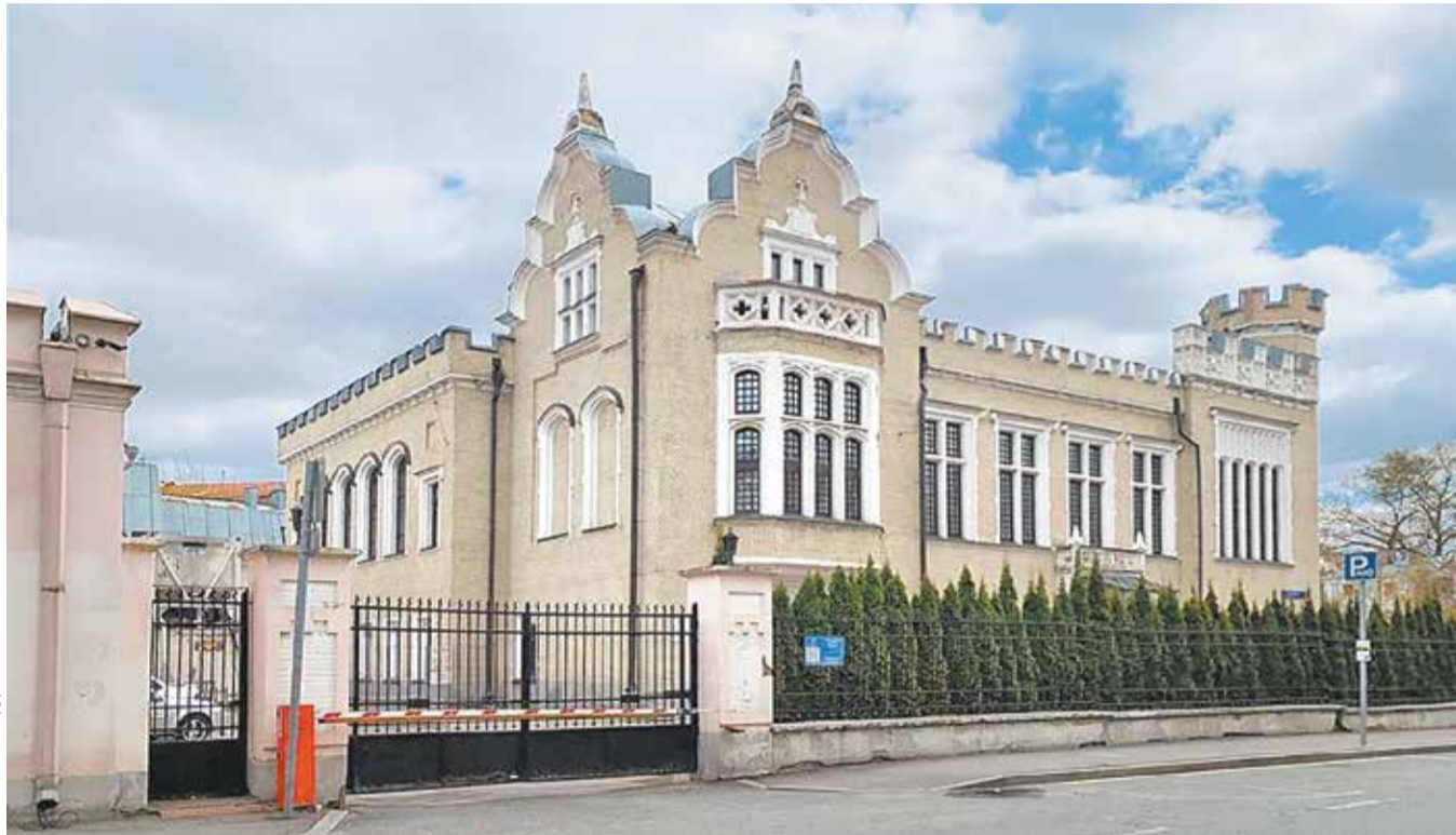
Городская усадьба промышленника Андрея Кнопа (Колпачный пер., 5), которую планируется превратить в музей

После реставрации усадьбу Кнопа приспособят под фамильный музей