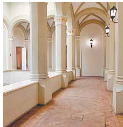
СОФЬЯ САНДУРСКАЯ / АГН «МОСКВА»