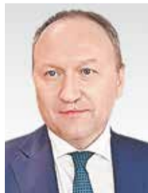
АНДРЕЙ БОЧКАРЕВ, ЗАМЕСТИТЕЛЬ МЭРА МОСКВЫ ПО ВОПРОСАМ ГРАДОСТРОИТЕЛЬНОЙ ПОЛИТИКИ И СТРОИТЕЛЬСТВА:

В течение последних десяти лет столичная градостроительная политика опирается на принципы комплексного, сбалансированного развития, что подразумевает согласованную, пришедшую в правильное соотношение застройку и ее наполнение объектами самого разного назначения. Проекты комплексного развития территорий (КРТ) по реорганизации бывших промышленных зон города объединяет программа «Индустриальные кварталы». Предполагается, что благодаря реализации отдельных проектов в рамках этой программы вместо так называемого «ржавого пояса» появятся точки роста и притяжения. Заброшенные предприятия должны превратиться в современные городские районы с высокотехнологичными и экологичными производствами. Также здесь планируется возвести социальную и инженерную инфра-